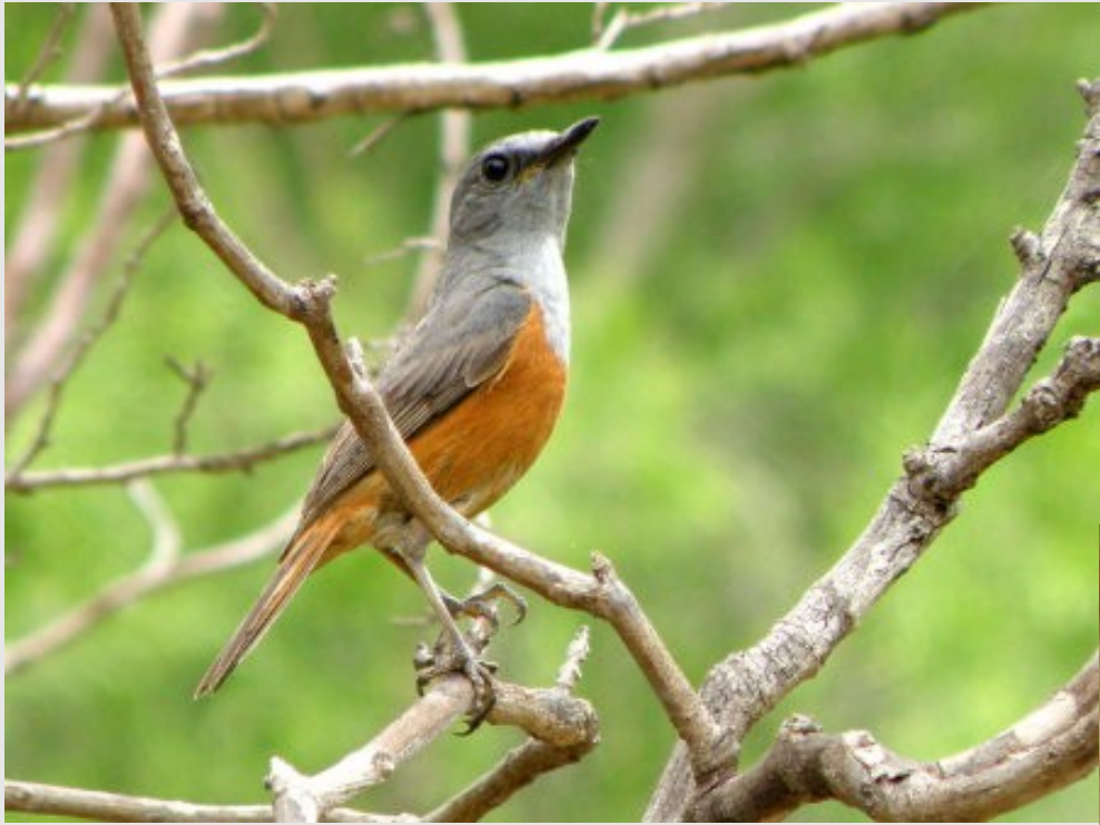
Comme un pinson