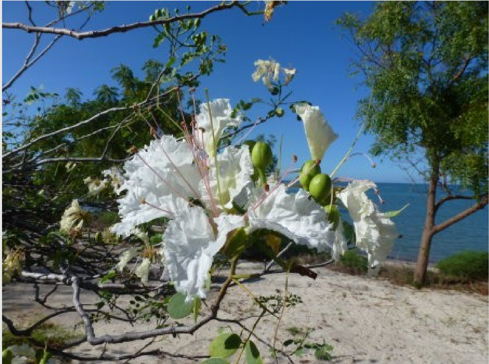
Le 1 janvier au petit déjeuner, à côté de Tuléar.