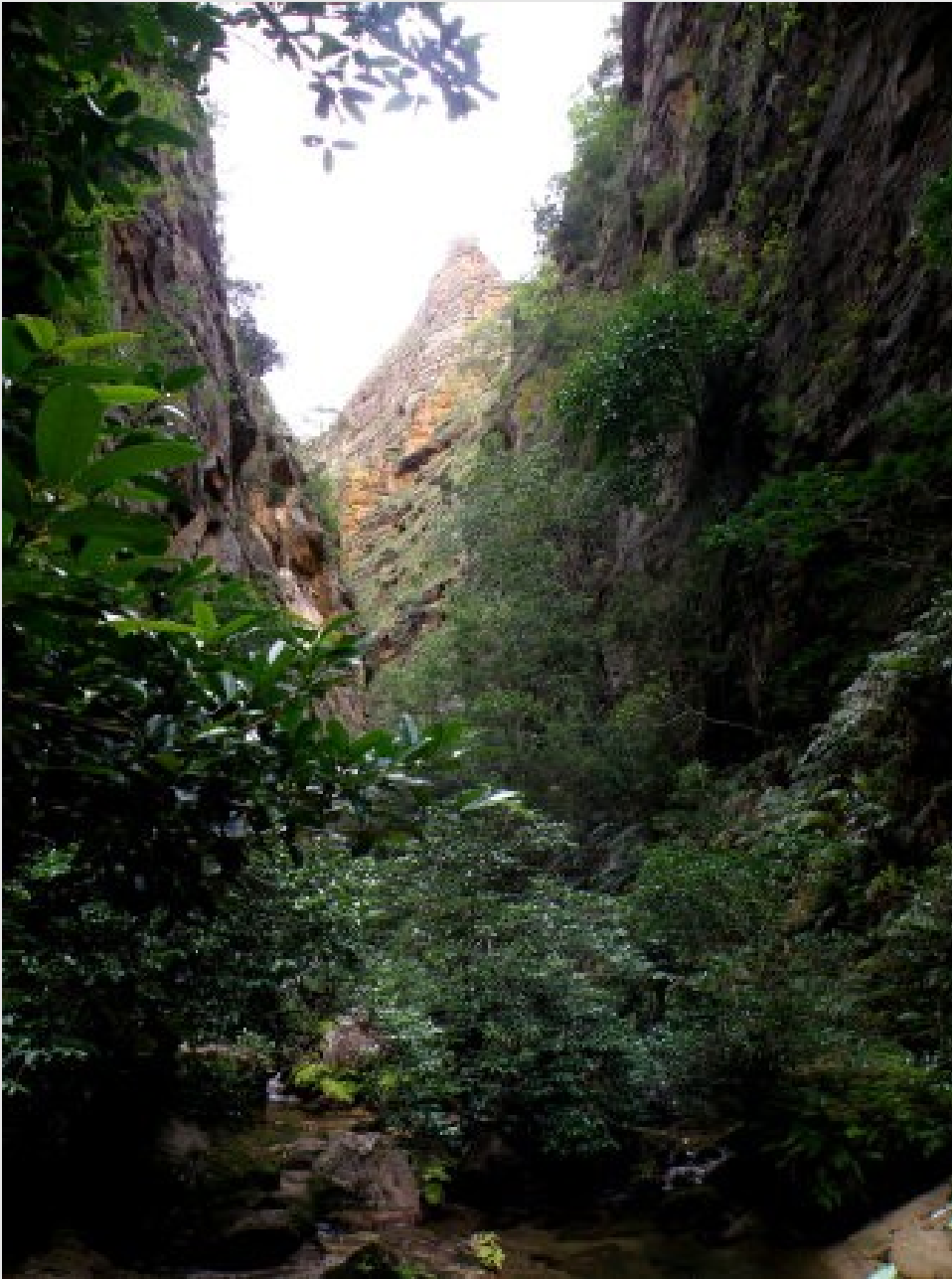
Le canyon aux makis