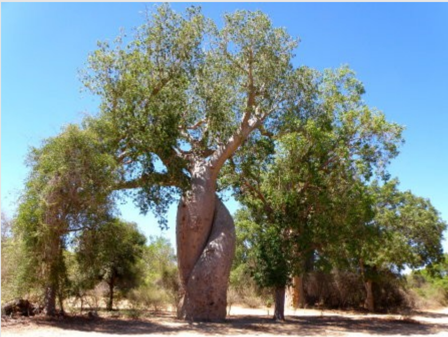
Le baobab amoureux