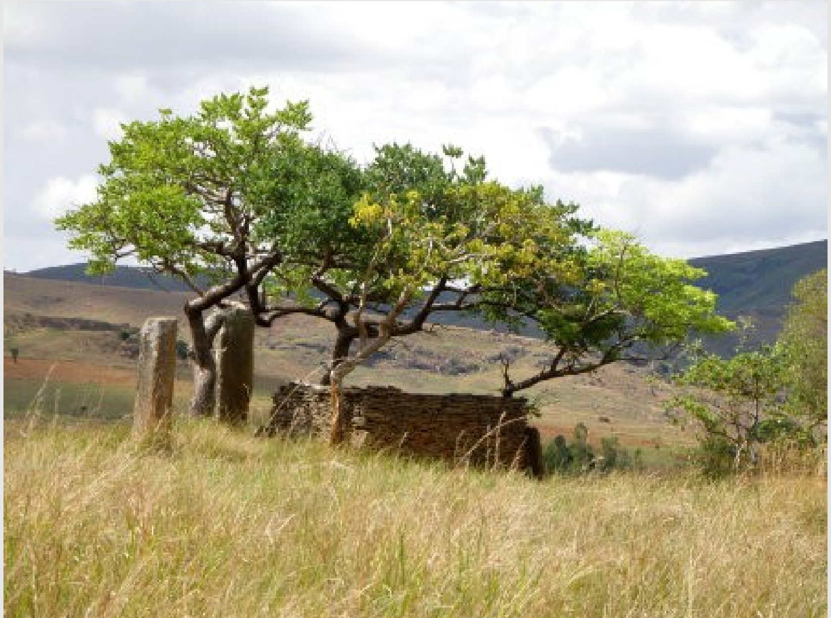
Un tombeau 'provisoire' pour célibataire, reconnaissable aux pierres levées.