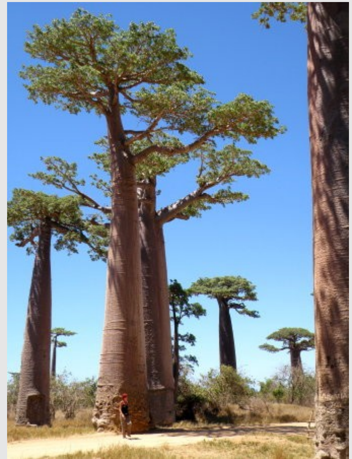
L'allée des Baobabs