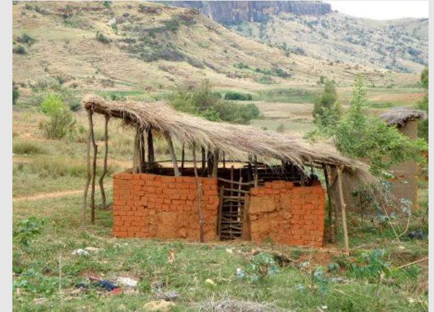
Une soue à cochons