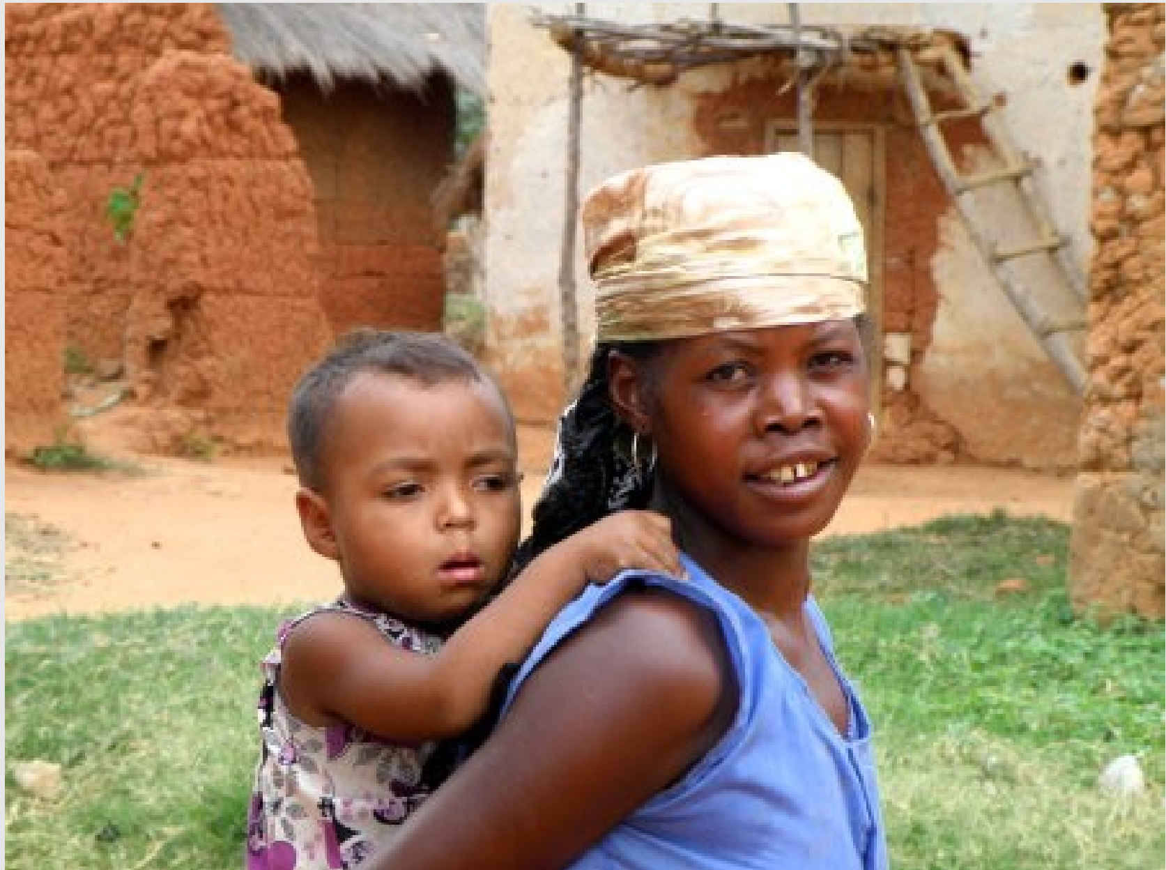
Une feuille d'or plaquée sur la dent est un signe extérieur de richesse.