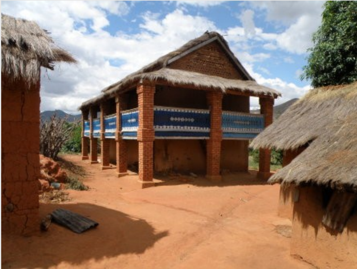
La maison d'une famille riche ou fortunée ?