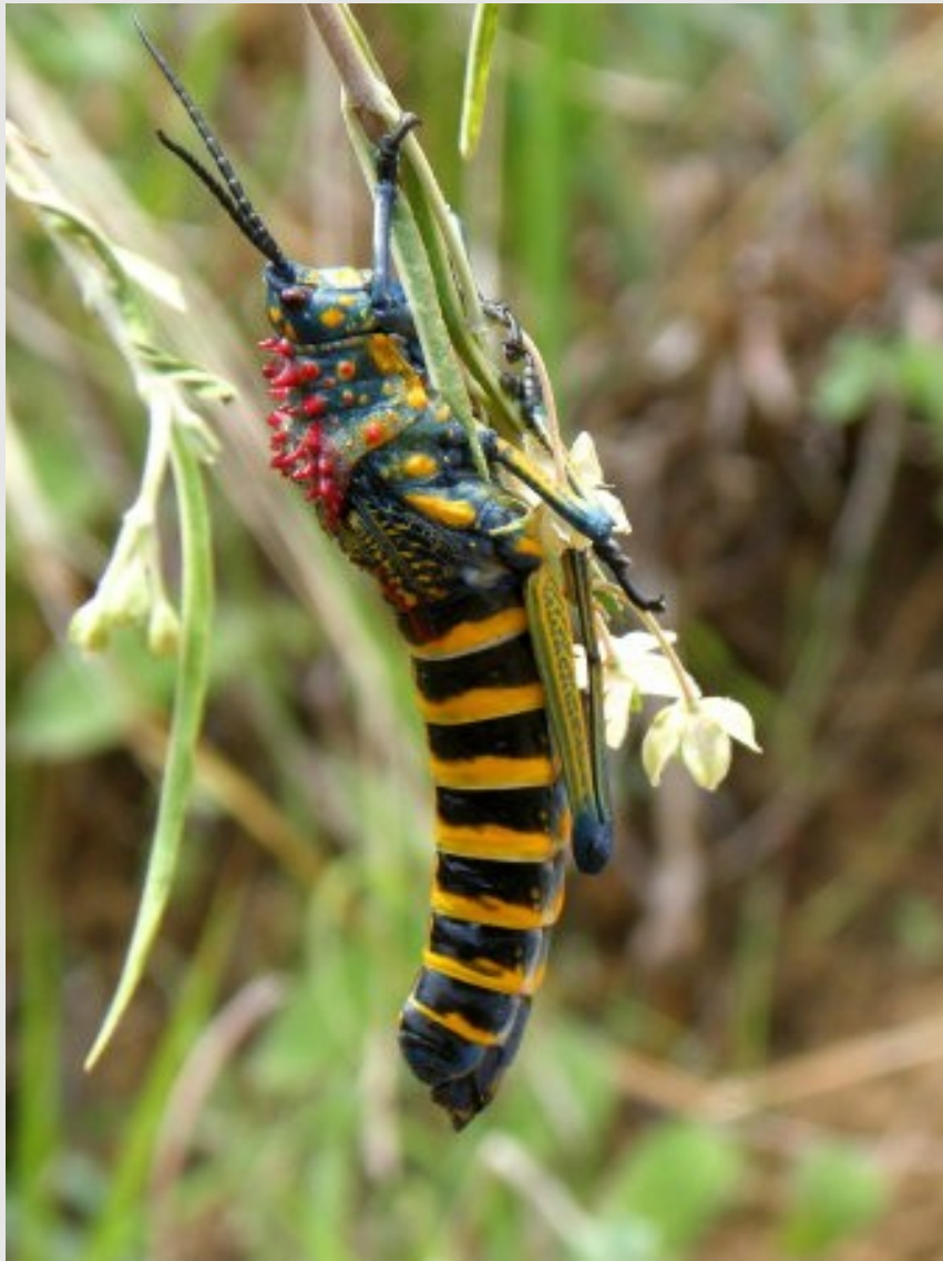
Sauterelle sans aile