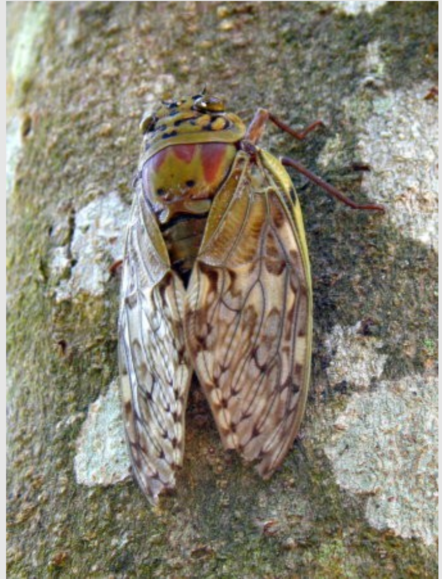
Cigale sans fourmi