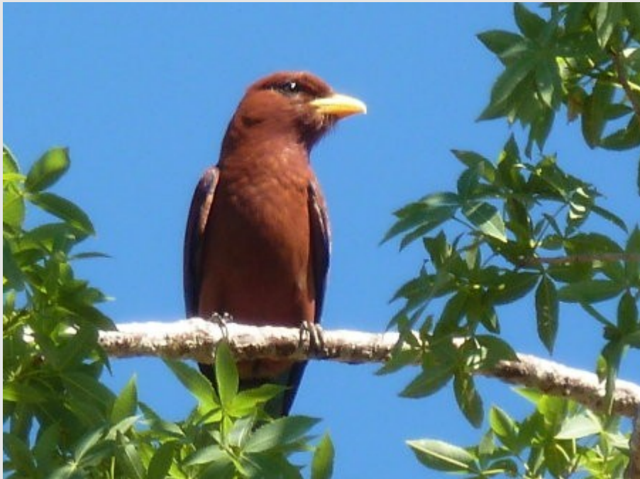
Un Rolle violet migrateur entre l'Afrique et Madagascar