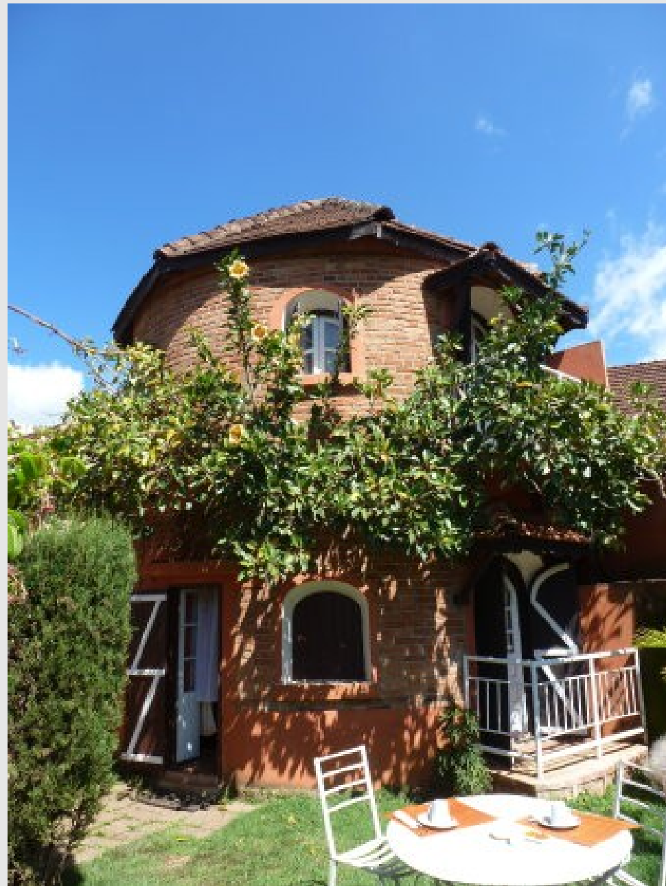
L'hôtel au petit déj