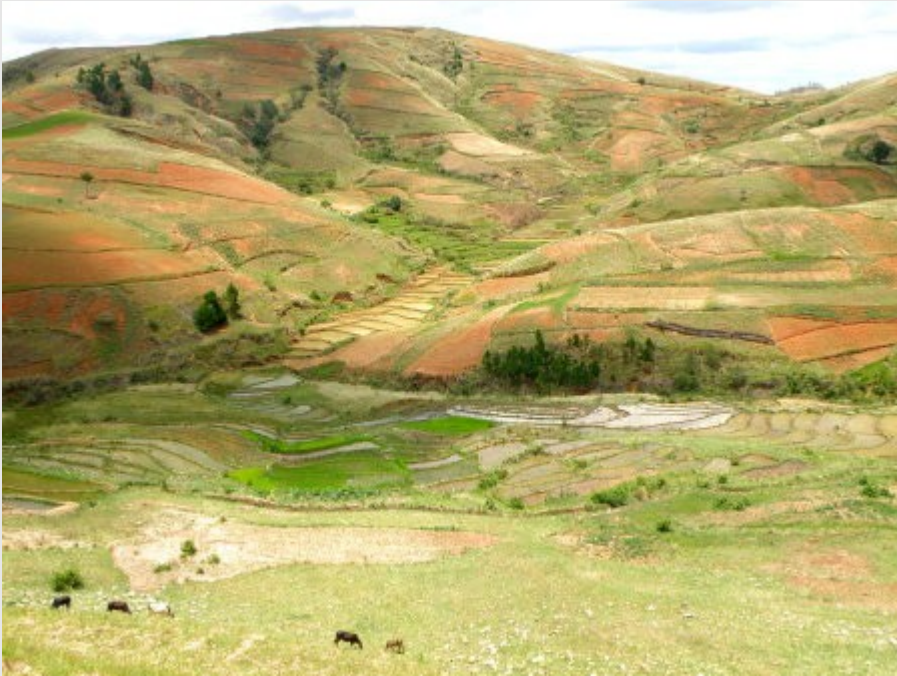
Entre Antsirabé et Morondave