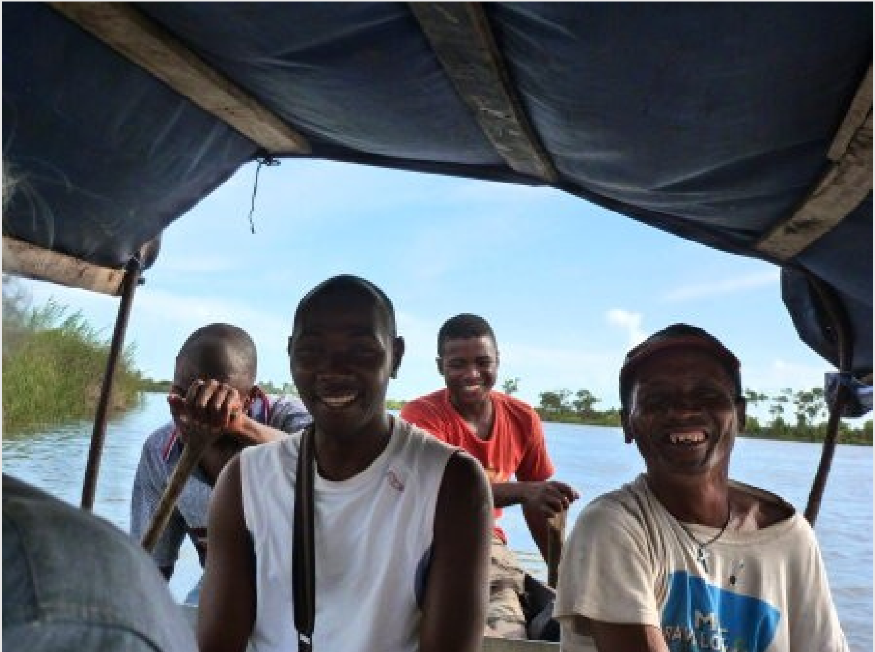
Le guide et les piroguiers des Pangalanes après un concert vocal polyphonique.