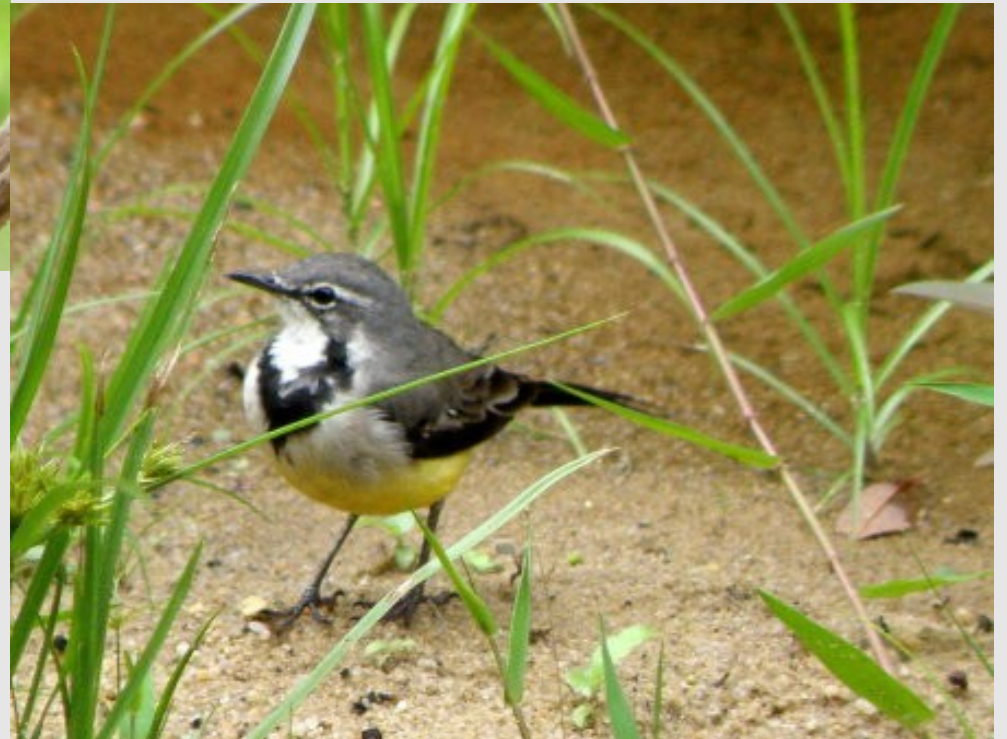
Comme une mésange