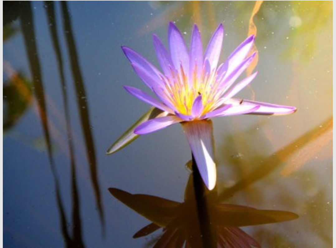
Au Lémur forest camp Ialatsara