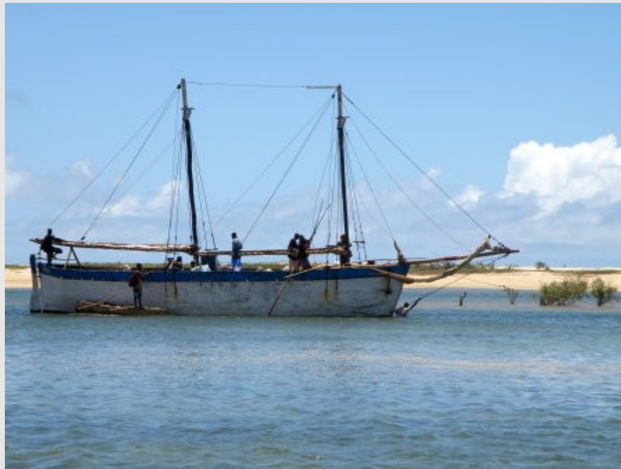
Belo sur mer