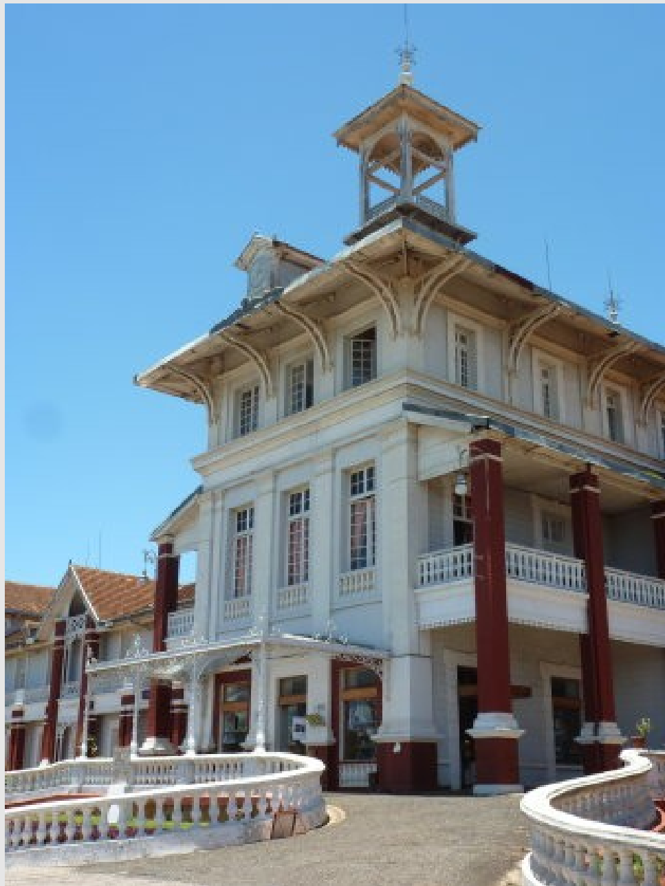
Vestige de l'époque coloniale