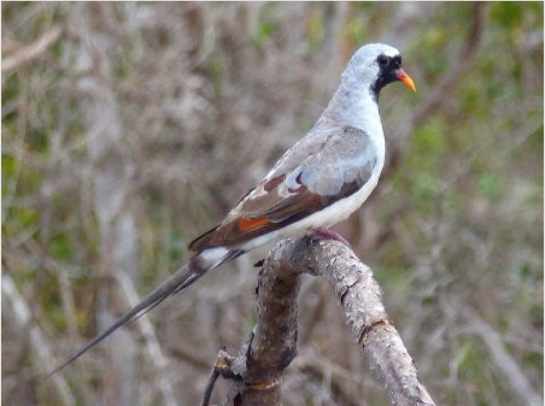
Une "tourterelle cendrée" adaptée aux brûlis ?