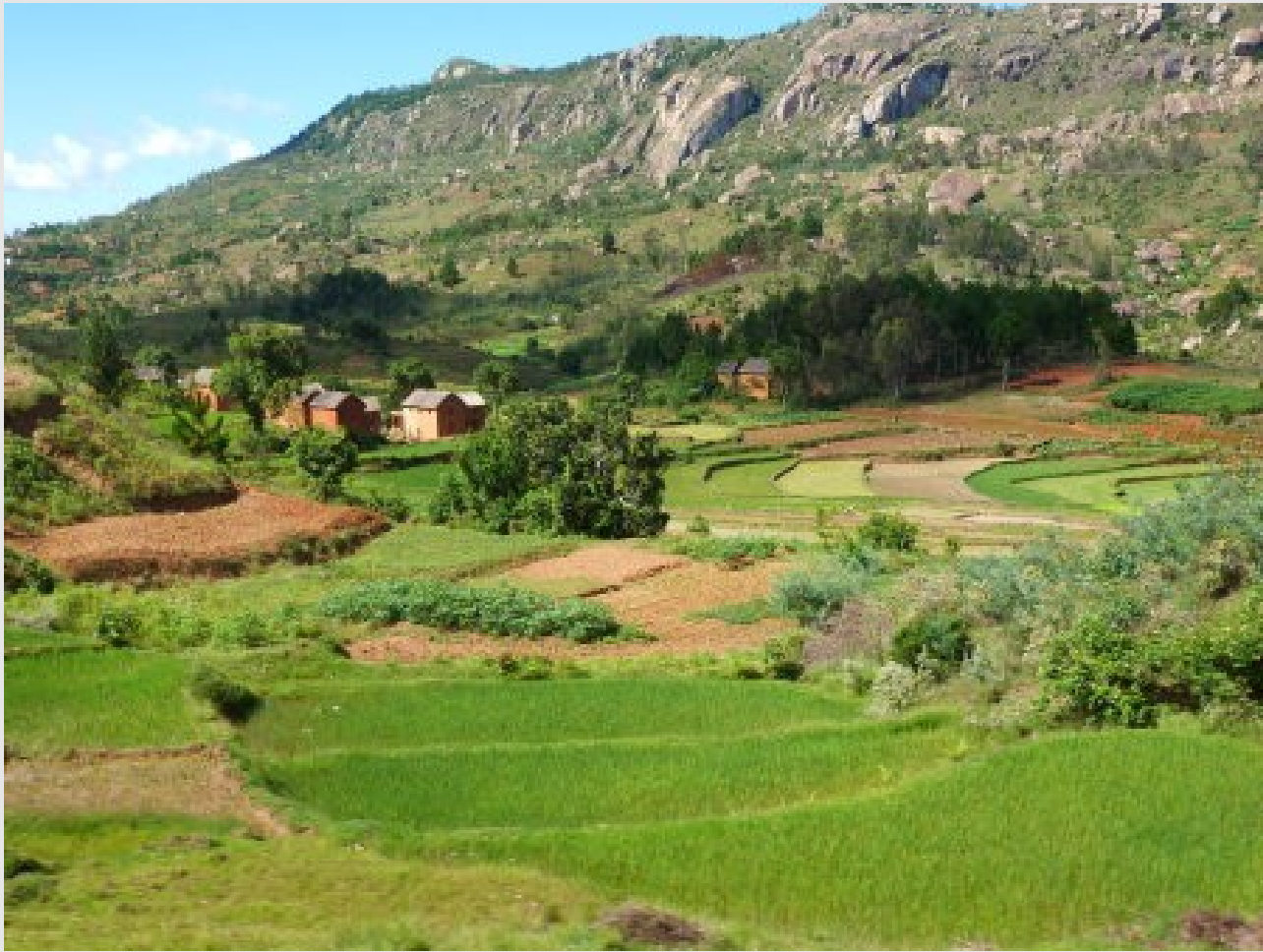
La campagne près de Tananarive