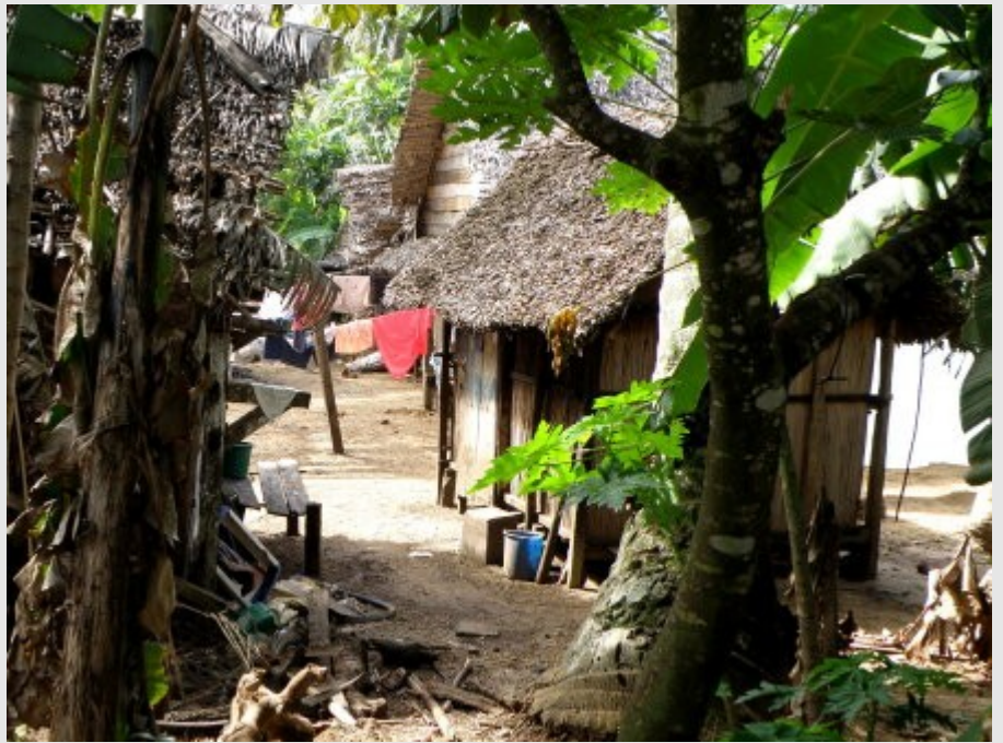
Village de pêcheurs près de l'hôtel