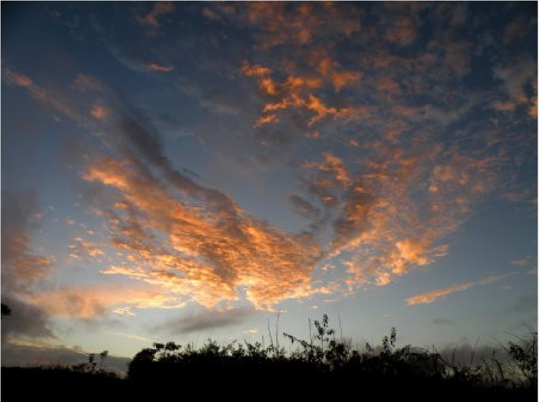
Levé du jour